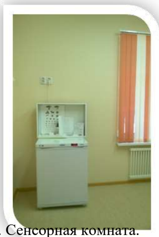
6. Сенсорная комната.